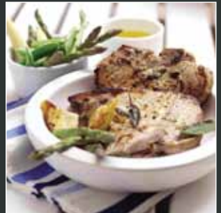
Golwython Porc Swmpus gyda Saets, Garleg a Lemwn