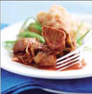
Caserol Porc Blasus