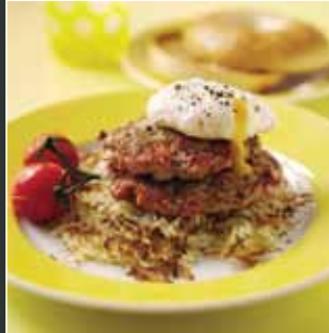
Brecwast hwyr - Patis Porc a Chig Moch