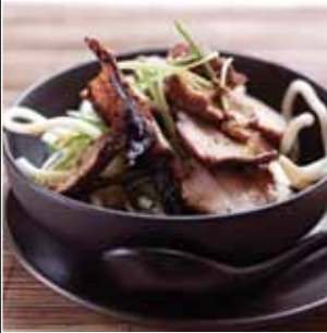
Tro-ffrio Porc, Sinsir a Shibwns

Mae dulliau bwtsiera porc wedi datblygu'n ddiweddar ac, erbyn hyn, mae amrywiaeth helaeth o wahanol ddarnau ar gael i wneud llu o wahanol brydau bwyd blasus yn gyflym er mwyn ateb gofynion ffordd o fyw teuluoedd heddiw.