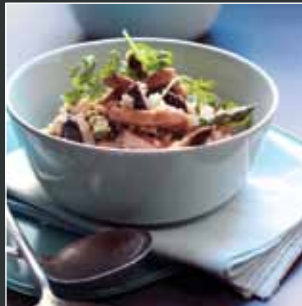
Risotto Porc a Madarch