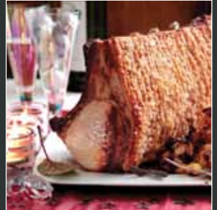
Lwyn rost o borc gyda stwffin Llugaeron a Mango